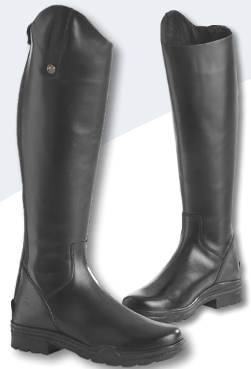
Maße in cm der Reitstiefel NORWICH