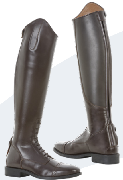
Maße in cm der Reitstiefel PARIS, braun