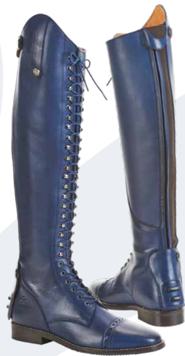
Maße in cm der Reitstiefel LAVAL, blau